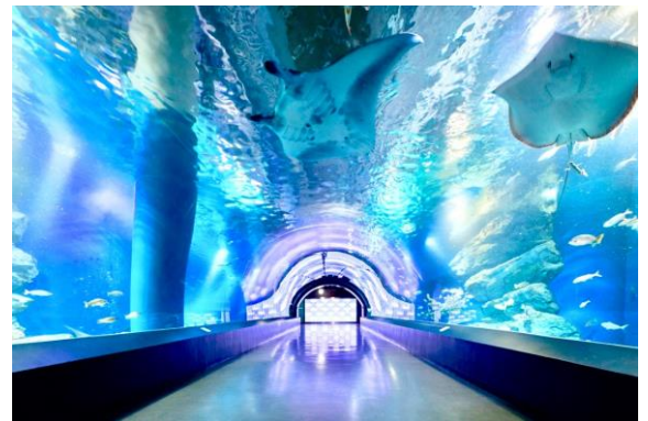
「夜のワンダーチューブ ※イメージ」