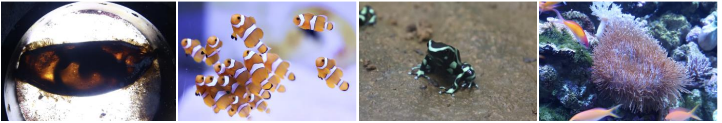
「左から:イヌザメの卵/カクレクマノミ/マダラヤドクガエル/ウミキノコ ※イメージ」

当館で生まれた「イヌザメ」や「カクレクマノミ」、「マダラヤドクガエル」などを展示。その他にも“無性生殖”で繁殖したサンゴのなかま「ウスコモンサンゴ」「ウミキノコ」がご覧いただけます。