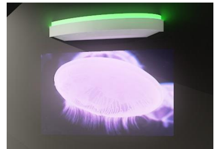
「インタラクティブサイネージウォール ※イメージ」

繁殖実績のある3種「ミズクラゲ」「カクレクマノミ」「オウサマペンギン」のライフサイクルをそれぞれ3つの大型モニターでご紹介します。また、イメージングライト(マクセル株式会社製)を用いたデジタルコンテンツ「インタラクティブサイネージウォール」でも解説を展開。アプリの感覚でご使用いただけ、タッチ操作で生きものの種類や場面が切り替わり、楽しみながら学べます。