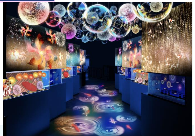
「祭り花火 展示/写真左から：バナナフィッシュ、ミナミトビハゼ、サザナミフグ ※イメージ」

小水槽と交互に並んだショーケースはお祭りの定番アイテム、お面や風車などを飾りました。露店をのぞき込むような感覚で生きものたちの様子をご見学いただけます。