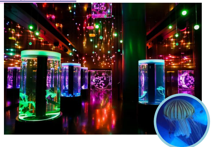
「ジェリーフィッシュランブル 展示/アカクラゲ ※イメージ」

7つの円柱水槽とフロア中央のシンボリックな水槽が並び、夏に多く見られる「アカクラゲ」をはじめ、優雅に漂うクラゲたちをご覧いただけます。その魅力を引き立てる音と光の演出は、約5分間の夏のプログラムを開催。活気に満ちたお祭りの様子、花火が打ちあがる趣深い夜、風鈴の涼しげな音色につつまれる3つのシーンを表現します。同イベントに合わせて新設された竹の縁台に座りながら、無数に広がる光の中で癒しの時間をお過ごしいただけます。