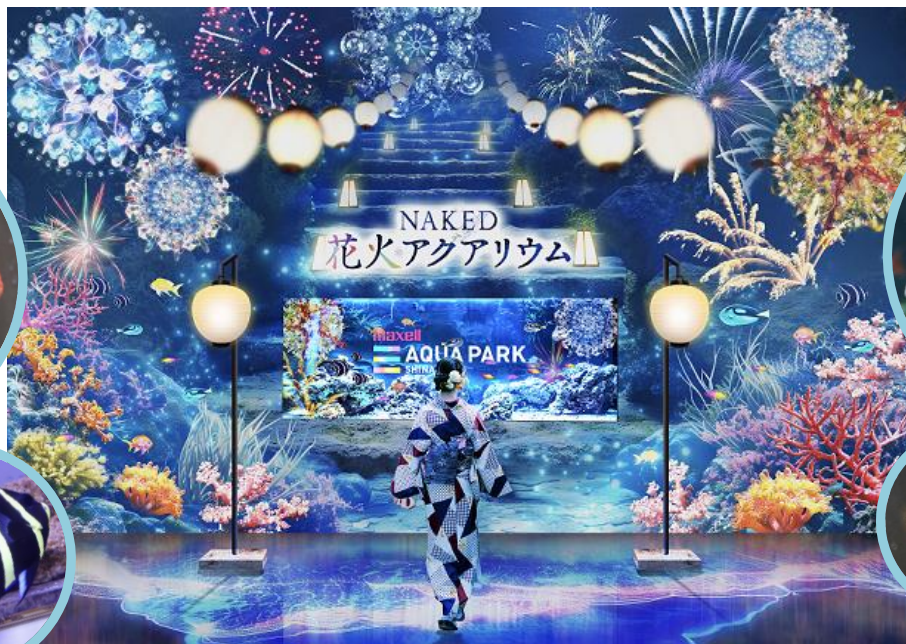
「ウミノ参道 展示/写真左上:スミレナガハナダイ、左下:フレンチエンゼル 右上:ナンヨウハギ、右下:フレイムエンゼル ※イメージ」

ゲストのアクションによって、花火が打ちあがるインタラクティブな仕掛けも取り入れながら空間丸ごと演出し、入口から美しい世界観へと引き込みます。