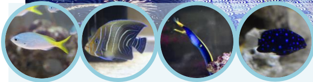
「海空花火/写真右：ショータイム 展示/写真左から：ユメウメイロ、サザナミヤッコ、ハナヒゲウツボ、ジュエルダムセル ※イメージ」