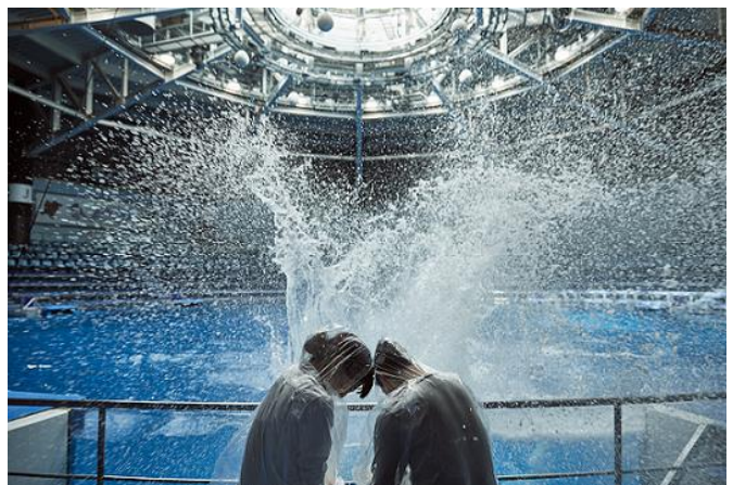
「Dolphin Splash Fes ※イメージ」