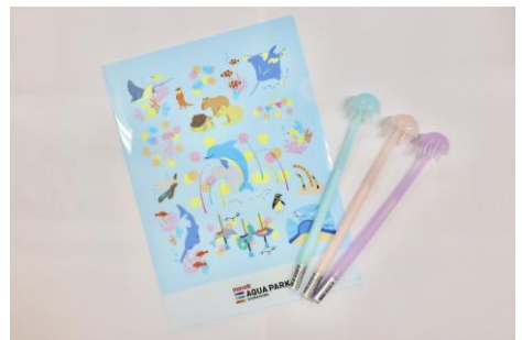
「③クリアファイル&④クラゲゲルペン」