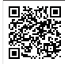
施設映像はこちら