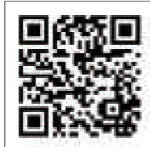
公式Webサイトはこちら