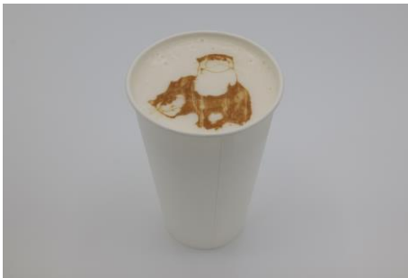
「②カワウソ プリント ビール」