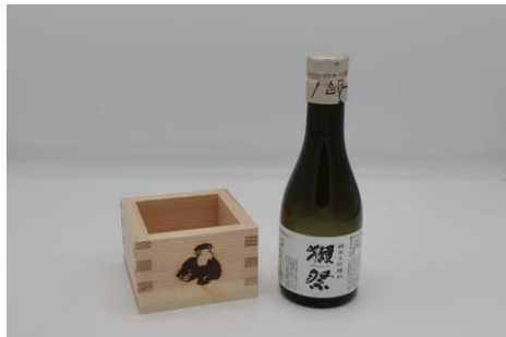
「①瀬祭&オリジナル枡のセット」