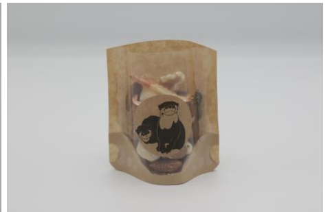
「③カワウソのおやつのおせ MIX ナッツ」