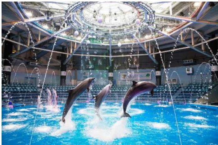
「イルカたちの輪舞 ※イメージ」

ドレスアップしてイルカたちとの舞踏会に出かけましょう! 自然光と水の演出が相まった輝く舞台上、序盤はフレンチポップスにのせた多彩なジャンプやトレーナーと息の合った水中パフォーマンスを披露。舞踏会に向けて着飾ってゆくシーンから、“ウキウキ感”につつまれて街へ繰り出す様子を表現します。プログラム後半は、舞踏会の幕開け! 会場一体となって踊る“ゲスト参加型”の演出や、ダンスパートナーのイルカたちがお届けするスプラッシュ、軽快なジャズワルツでお送りする変形技の数々など、心華やぐ時間を提供します。中世ヨーロッパの装いから着想を得たキュートでクラシカルな衣装にもご注目ください。