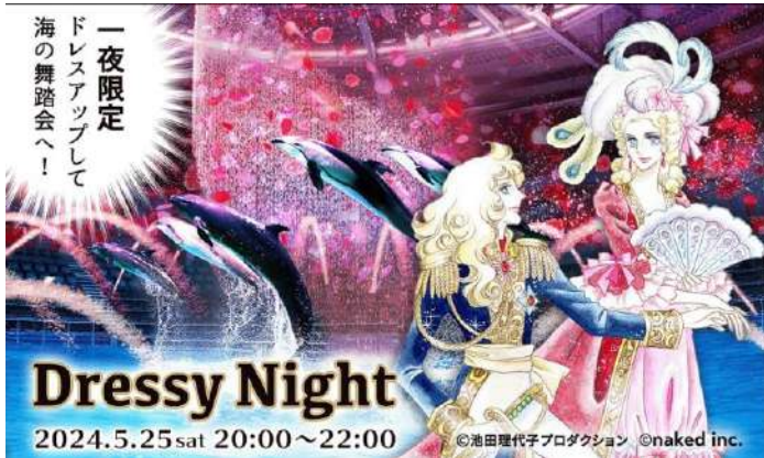
「Dressy Night ※イメージ」

“ベルばら”コラボならではのナイトイベントを開催します。水族館＝カジュアルのイメージを覆し、思い思いの最高のオシャレをしてご来館いただく「Dressy Night (ドレスシーナイト)」! ドレスアップした後の“ウキウキ”した気持ちで、華麗なアート空間でお写真撮影をしたり、愛らしい生きものたちを観察したり。閉館後の人数限定の館内で、王侯貴族さながらの優雅な一夜を過ごしませんか? おとな料金は、当館フォトスタッフによる記念写真付きです。