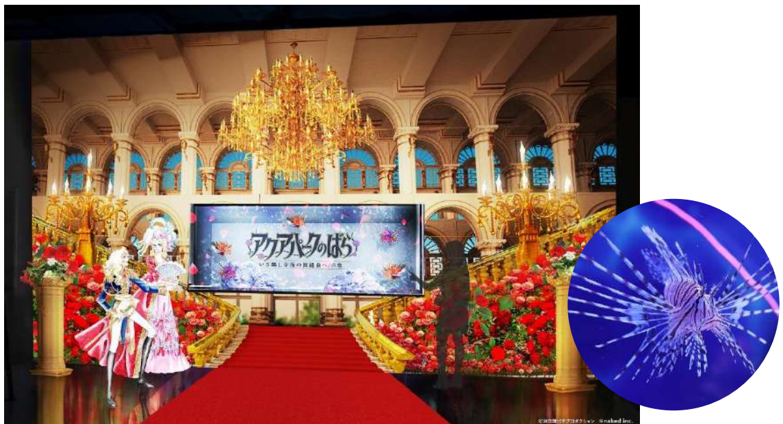
「エスコート大階段／ハナミノカサゴ ※イメージ」

思い思いにドレスアップしてご来館いただき、煌びやかなシーンでのお写真撮影もお楽しみいただけます。