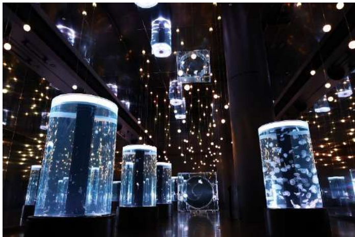
「白薔薇のワルツ ※イメージ」

7つの円柱水槽と全面がクリスタルのシンボリックな水槽が並ぶ、幅約9m×奥行約35mの大空間。98個の球形LEDと水槽照明が音楽に合わせて連動し、クラゲの魅力を引き立てるとともに、無数の光が広がる神秘的な空間を創出します。 今回はエリア名「白薔薇のワルツ」を体現する、約5分間のプログラムを開催。“白薔薇=オスカル”に見立て、 前半は黄色や白が基調のライティングで、キャラクターの持つ優雅さ、気高さをイメージ。後半は雰囲気をはらりと変え、華やかさの裏にある葛藤や苦悩をブルーのライティングで表現します。