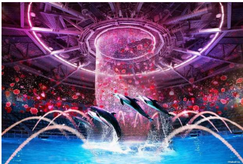
「美しき薔薇物語 ※イメージ」

煌びやかな宮廷生活、キャラクターたちが紡ぐ愛、そして革命を経て新しい時代へー。 “ベルばら”のストーリーをイルカたちのダイナミックなジャンプと優雅な水中パフォーマンスで表現します。 アニメ版「ベルサイユのばら」の楽曲をメインに使用し、終盤では名曲「薔薇は美しく散る」にのせた華々しいフィナーレをお届けします。