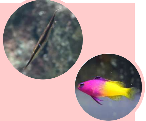
「上:ヘコアユ/下:ロイヤルグラマ」