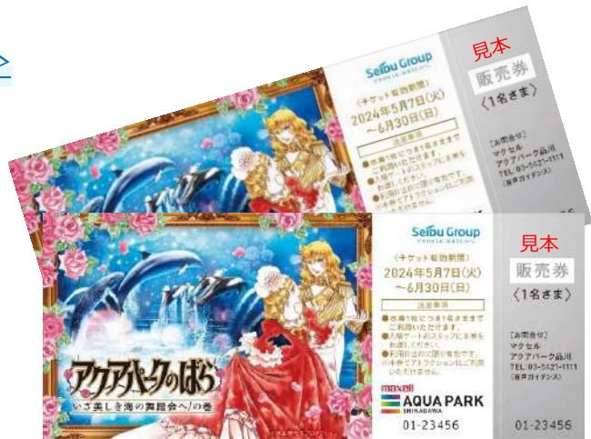
「コラボチケット ※イメージ」

【内 容】水族館ご入場1名さま分+ミニフォトカード&アクリルミニフォトスタンド1セット