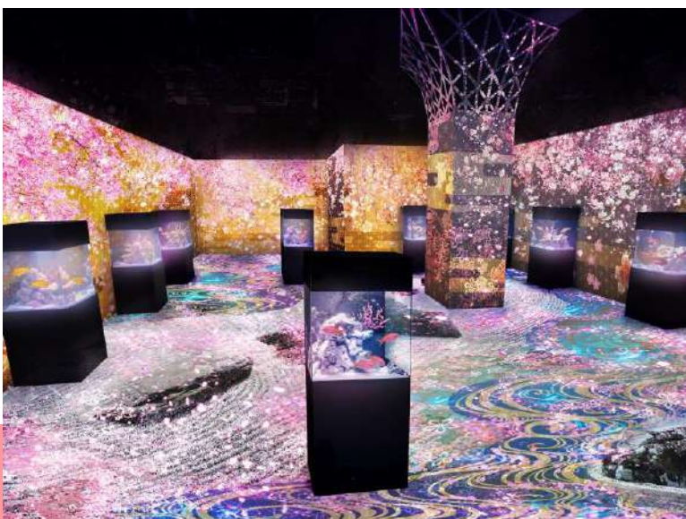
「舞桜の庭 ※イメージ」

まさに桜の美しさと日本らしさ、そして生きものたちとのお花見をお楽しみいただける“桜舞う日本庭園”です。