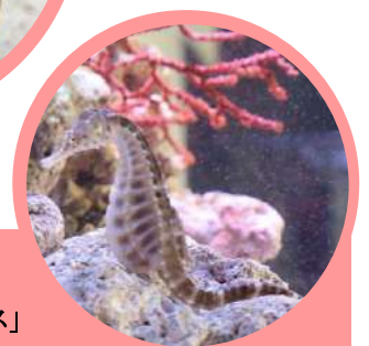
下：ポットベリーシーホース」