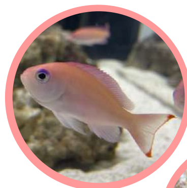
「上：ケラマハナダイ／