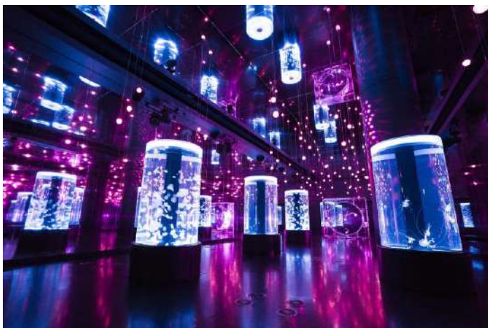
「ジェリーフィッシュランブル ※イメージ」

幅約9m×奥行約35mにもおよぶ、クラゲ展示の大空間。フロアに並ぶ7つの円柱水槽と、中央のシンボリックな水槽では「ミズクラゲ」や「カラーゼリー」など、多彩なクラゲがご覧いただけます。生きものの美しさを引き立てる音と光の演出も「サクラアクアリウム」仕様に。天井から下がる98個の球形LEDと水槽照明が音楽に合わせて連動し、桜色の光が無数に広がります。まるでクラゲと楽しむ夜桜空間。美しい空間と優雅に漂う姿に魅せられて、癒しのひとときをお過ごしいただけます。