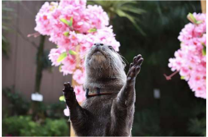
「カワウソのミニパフォーマンス ※イメージ」

コツメカワウソの“たいよう”が屋外スペース「フレンドリースクエア」に登場し、身体能力を活かしたパフォーマンスをお届けします。春らしく、桜満開のステージでは約12種類ある鳴き声の一部を披露したり、お食事中のワイルドな表情を見せてくれたり。飼育スタッフの解説と合わせて、カワウソのベーシックな生態を学べる他、 今春は花びらを模した“積み木”を使って、特長のひとつ“手先の器用さ”をご紹介します。 ラストはたいようが完成させた桜のオブジェとともに、写真撮影をお楽しみいただけます。