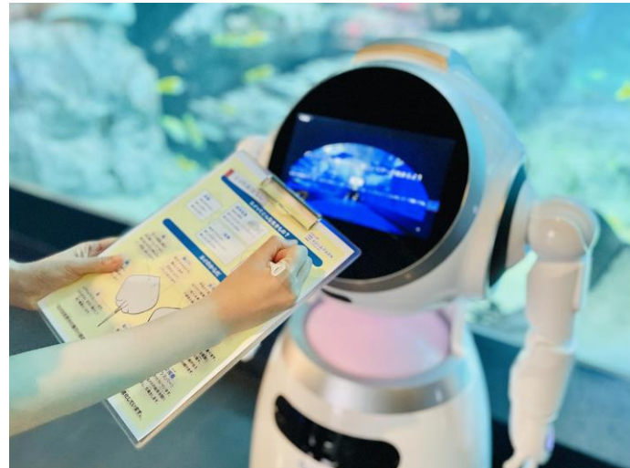
「ロボットガイド ※イメージ」

当館らしくAIロボットを介したエンターテインメント性あふれるプログラムで生きものの魅力や生態をお伝えします。