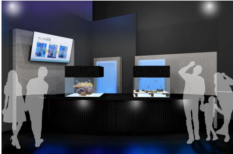
「Coral Lab ※イメージ」

同エリアでは、バーカウンター横にある4つの水槽を通じてサンゴの美しさや魅力をお伝えしてまいりましたが、今回「Coral Lab」の誕生によって繁殖の様子など異なる側面も知ることができ、サンゴへの理解をさらに深めていただけます。