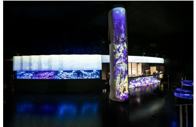
「コーラルカフェバー ※イメージ」