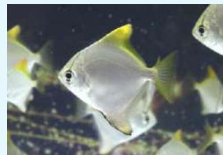
■名前に“ツバメ”が含まれる「ヒメツバメウオ」