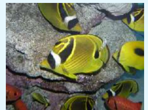
■英名に“Raccoon(=アライグマ)”が含まれる「チョウハン」