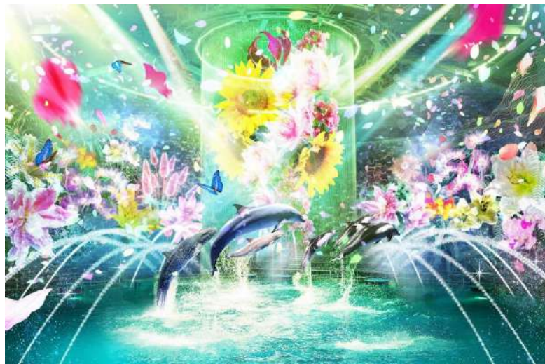
「Beauty of Flower ※イメージ」