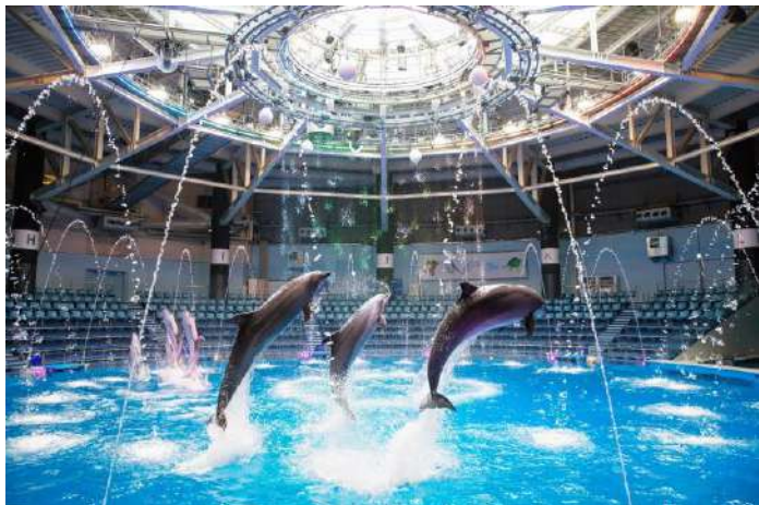
「Sky Symphony ※イメージ」

雨空から晴れ渡り、やがて虹が架かるまでをたどるストーリー仕立てのプログラム。イルカたちの躍動にムービングライトやスモークマシン、効果音などの演出が融合し、移ろう“初夏の空模様”を表現します。雨の中でイルカたちが楽しく遊ぶ様子から、突然の雷雨が到来。やがて静けさにつつまれる会場には、雲の隙間から徐々に光が差し込む情景が現れ、終盤では青空をイメージした爽やかなメロディにのせて、パフォーマンスをお届けします。デiver. の既存コンセプトである“ゲスト参加型”の要素として、その場でできる簡単な振り付けを取り入れ、会場一体となって盛りあがる演出で【熱い興奮】を感じていただけます。