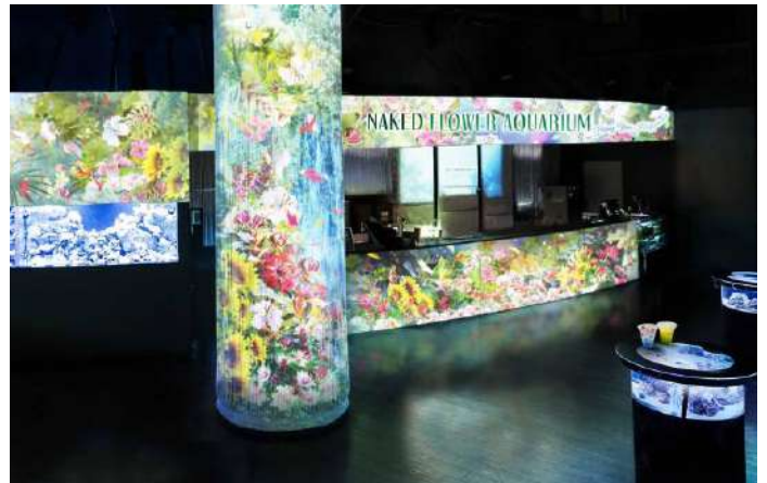
「Floral Cafe Bar ※イメージ」

色とりどりのデジタルフラワーにつつまれた可憐なカフェバーでは、海中の花(=発光サンゴ)の水槽を眺めながら、ドリンクや軽食をお召しあがりいただけます。こちらでは、ブルーやイエローなど花々の美しい色合いをイメージした「フラワーアクアリウム」限定メニューを4種類ご用意し、ゲストの【味覚】を満たします。また、感染対策の一環として、提供カウンター横には、手指消毒をエンターテインメント化した「NAKEDつくばい™」を設置。手のひらに花びらが舞い、同時にアルコールが噴霧されます。