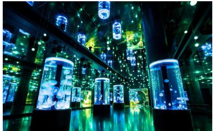
「Jellyfish Ramble ※イメージ」

音と光の演出で魅せる、クラゲ展示の大空間。幅約9m×奥行約35mにもおよぶフロアでは、7つの円柱水槽と全面がクリスタルのシンボリックな水槽が並び、さまざまな種類のクラゲがご覧いただけます。また、通常演出(約3分間)と交互に展開される季節演出(約5分間)では、ブルーやグリーンを基調としたカラーで初夏の爽やかさを表現します。優雅に漂うクラゲと無数の光が広がる幻想的な世界で、うっとり【恍惚感】に浸るひと時がお楽しみいただけます。