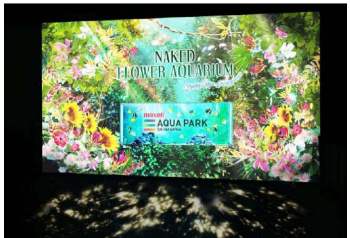
「Welcome Flower Gate ※イメージ」

お足元には木漏れ日が揺れ、さらに、壁に手をかざすことで可憐な花びらが現れるインタラクティブな仕掛けもご用意。まるで海中の“花園”に足を踏み入れたような【期待感】を提供し、先のエリアへの期待を高めます。