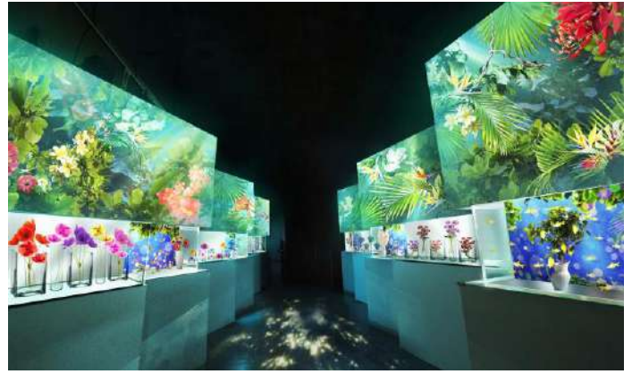
「Blooming Street ※イメージ」

水槽と花のアートワークを飾ったショウケースが交互に並び、映像演出がさらなる彩りを添える“アトリウム”のようなエリアです。今回は7つの水槽に、それぞれ愛や幸せあふれる“花言葉”と、その植物の名前にちなんだ生きものを展示。例えば、“純真・無垢”の花言葉を持つユリの花を装飾した水槽では「オグロクロユリハゼ」をご覧いただけます。1つ1つの水槽をのぞき込みながら進み、生きものの躍動と花言葉にふれることで【前向きな気持ち】をもらえます。