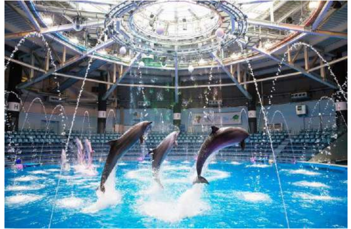
「Christmas Memories ※イメージ」

昼のプログラムは家族や友達、恋人と過ごした“クリスマスの思い出”をテーマに、エモーショナルに展開します。天窓から差し込む自然光が水の演出と相まって、きらめく舞台を創出。多彩なライティングとクリスマスソングによって華やかさを増したイルカのパフォーマンスは、クリスマスのさまざまなシーンや大切な人と過ごす幸せ、少しセンチメンタルな心情などを場面ごとに表現します。さらに、会場一体となってお楽しみいただける“参加型”の要素を加えて世界観に引き込むことで、ゲストはパフォーマンスによって紡がれるストーリーの主人公になった気分でお楽しみいただけます。