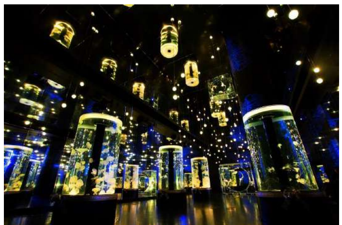
「Jellyfish Ramble ※イメージ」

両壁と天井が鏡面になっている、幅約9m×奥行約35mにおよぶクラゲ展示の大空間。天井から下がる98個のLEDライトと水槽照明が音楽に合わせて連動し、スターアクアリウム限定の演出で、無数の星が輝く“夜空”を創出します。フロアに並ぶ7つの円柱水槽と、全面がクリスタルのシンボリックな水槽にはミズクラゲやインドネシアシーネットルなどが優雅にたどる、幻想的な空間演出とともに訪れるゲストに癒しを提供します。