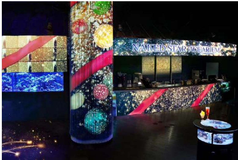
「Shiny Starry Bar ※イメージ」

発光サンゴの水槽が並ぶカフェバーは、真っ赤なりボンとカラフルなクリスマスオーナメントの映像によって大胆に装飾され、心おどる空間へと変身します。また、3分に一度、映像が満天の星空に変わるショータイムを設け、星降るロマンチックなひと時をお届けします。クリスマス限定メニューには、ワインカラーやグラデーションが映えるドリンクの他、星形饅頭なかのワンポイントがキュートなパフェをご用意しています。