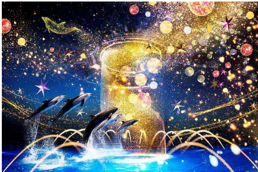
「Bright Christmas Party ※イメージ」