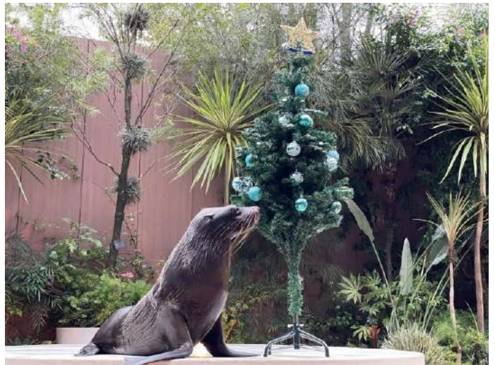
「ミニパフォーマンス(オットセイ)※イメージ」

当館唯一の屋外エリア「フレンドリースクエア」で開催する、プログラム「ミニパフォーマンス」が平日限定で再開します。人気の動物たちが登場し、各々の身体能力を活かしたパフォーマンスを披露。会場はオープンエアな空間で心地よく、動物たちの息づかいを間近に感じることができます。また、今回はツリーやプレゼントボックスなど、クリスマスにちなんだアイテムを用いた季節感あふれる演出で、動物たちの魅力をお伝えしてまいります。