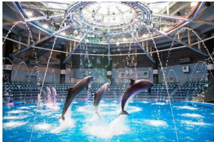
「Sky Symphony ※イメージ」

さらに、プログラム構成には“新しい生活様式”からヒントを得た2つのノンバーバル要素「①サイレントタイム」「②ゲスト参加型」を織り込み、MCや楽曲を入れない無音の空間で感じるイルカたちの“躍動感”や、会場一体となって盛りあがる演出で、ゲストに【熱い興奮】を感じていただけるパフォーマンスが完成しました。