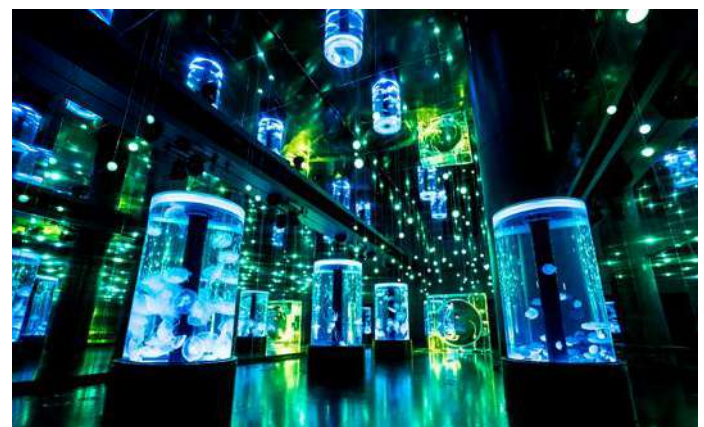
「ジェリーフィッシュランブル ※イメージ」

7つの円柱水槽と全面がクリスタルのシンボリックな水槽が並ぶ、クラゲ展示の大空間。生きものの魅力を引き立てる水槽照明と、98個のLEDライトが音楽に連動して輝き、鏡面になっている天井や両壁に反射して無数の光がエリア全体に広がります。今回は晴れ渡る初夏の空や、新緑をイメージしたブルーとグリーンが基調のライティングで3分毎に季節演出を開催。うっとり【恍惚感】を感じる、幻想的な光景がお楽しみいただけます。