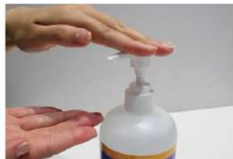
アルコール消毒液の設置