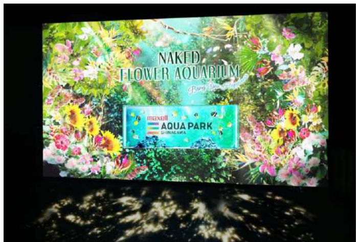
「Welcome Flower Gate ※イメージ」

色鮮やかなデジタルアートの花々と緑に覆われた、華やかなエントランス。中央の水槽には「トゲチョウチョウオ」や「ハタテダイ」がまるで“蝶”のように舞泳ぎ、ゲストの来訪を歓迎します。さらに、足元には木漏れ日の映像が優しく揺れ、体感的にお楽しみいただくことで、これから始まる「フラワーアクアリウム」への【ワクワク感(=期待感)】を高めます。