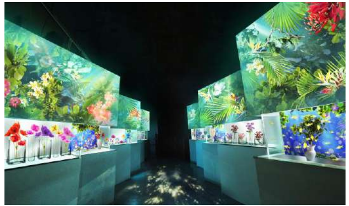
「Blooming Street ※イメージ」

花の造作と水槽が交互に並ぶ“アトリウム”のようなエリアです。壁や床にも映像演出が施され、空間全体で「フラワーアクアリウム」をお楽しみいただけます。こちらでは7つの水槽ごとに愛や幸せあふれる“花言葉”と、その植物の名前にちなんだ生きものを展示。例えば黄色の体色が鮮やかな“レモンテトラ”の水槽は、“誠実な愛”の花言葉を持つレモンの花の装飾とともに楽しみいただけます。1つ1つをのぞき込みながら言葉にふれていただくことで、ゲストに【前向きな気持ち】をもたらします。