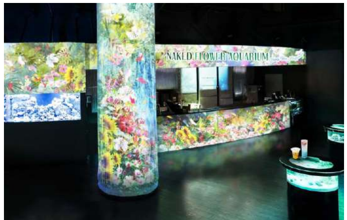
「Floral Cafe Bar ※イメージ」

海中に咲く「花」のような発光サンゴの水槽と、色彩豊かな映像の「花」が共演する美しいカフェバーでは、イベントと連動したオリジナルメニューをご用意しています。初夏の爽やかさや植物の色合いをイメージし、可憐な花々の名前がついたドリンクとスイーツは全部で5種類。なお、ご購入いただいた商品は館内での持ち歩きも可能です。