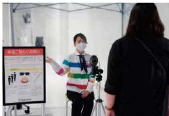
体温モニタリング