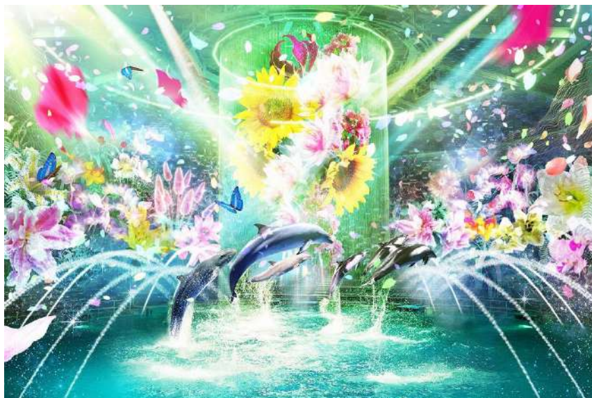
「Beauty of Flower ※イメージ」

【4月24日(土)～6月27日(日)※5月1日(土)～5日(水・祝)を除く】19:00 ※6月13日(日)は貸し切り営業のため、実施いたしません。 【5月1日(土)～5日(水・祝)】19:30