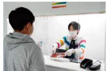
アクリルパネルの設置