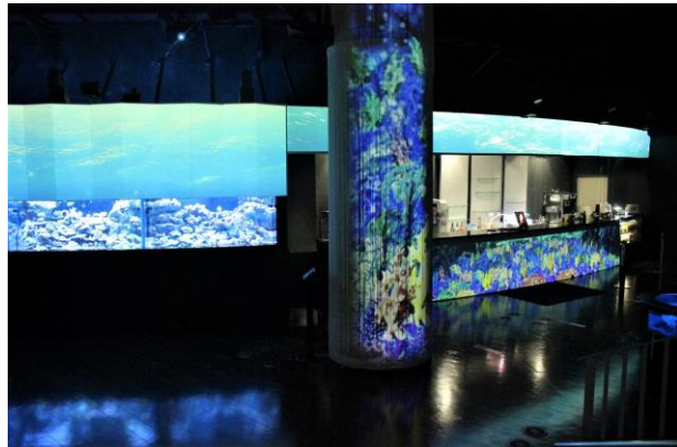
「コーラルカフェバー ※イメージ」

12月26日(土)～2021年2月28日(日)までの期間、冬の輝きや淡雪をイメージした季節限定メニューの他、昨年大好評いただいた当館オリジナルデザインのスーベニアボトル付きドリンクも販売いたします。