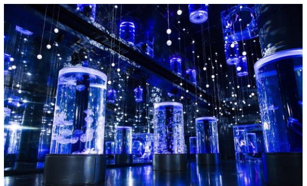
「ジェリーフィッシュランブル ※イメージ」

天井と両壁が鏡面になっている、幅約9m×奥行約35mの大空間。エリアには7つの円柱水槽と全面クリスタルのシンボリックな水槽が並び、ミズクラゲやインドネシアシーネットルなどが優雅に漂います。今回は、頭上から下がる98個のLEDライトと水槽照明をブルーやホワイトに変更し、さらに北欧調のメロディーを用いることで“冬の美しさ”を表現します。無限に広がる光とクラゲによる、まるで雪が舞い降りるかのような幻想空間がお楽しみいただけます。