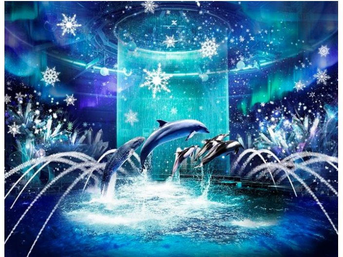
「BRIGHT CRYSTAL ※イメージ」

【水(噴水、ウォーターカーテン)】・【光(ムービングライト、水中照明)】・【映像(プロジェクションマッピング)】・【音(12.1ch サラウンド)】などの最先端技術とイルカたちのダイナミックなパフォーマンスが織りなす、唯一無二のプログラムです。デジタルアートで描かれるクリスタルやオーロラ、雪の結晶が円形スタジアムの一面に広がり、そのきらめきに連動するようにイルカたちが華やかなジャンプを繰り返します。360度美しい冬の世界観につつまれる、“没入型ドルフィンパフォーマンス”がお楽しみいただけます。