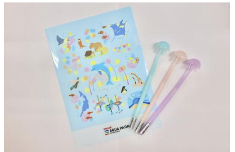
「クリアファイル & クラゲゲルペン」