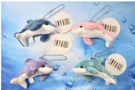
「ボールチェーンマスコット」

クラゲのマスコットが付いた「クラゲゲルペン」は不思議な手触りとパールトーンの可愛い色合いが人気です。