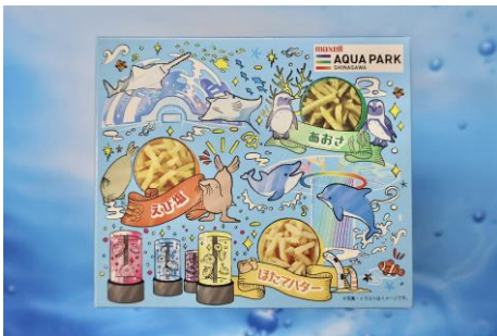
「ポテトスティック」